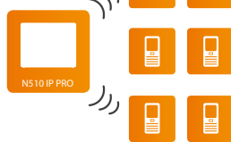
N510 IP PRO

Возможность подключения до 6 трубок DECT