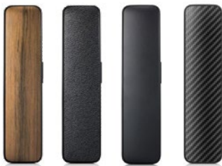
DECT-Telefonhörer Holz S30853-H4020-R121 Leder S30853-H4020-R111 Kunststoff S30853-H4020-R101 Carbon S30853-H4020-R131