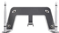
Kit für Wandmontage S30853-H4030-R101